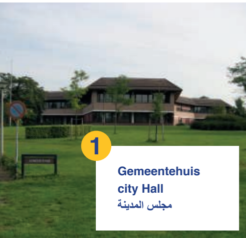
1 Gemeentehuis city Hall مجلس المدينة

يبلغ عدد سكان بلدية أومين (Ommen) حوالي 18500 نسمة. وتشتهر بلدية أومين (Ommen) بمركزها الجذاب وطبيعتها الخلابة بما فيها من أشجار ونهر فيخت (Vecht).