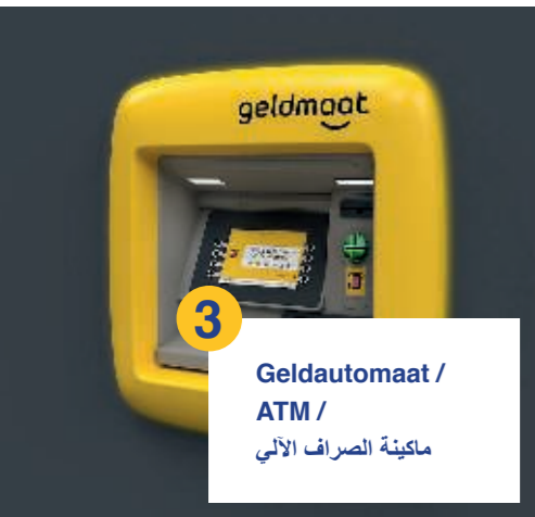
3 Geldautomaat / ATM / ماكينة الصراف الآلي