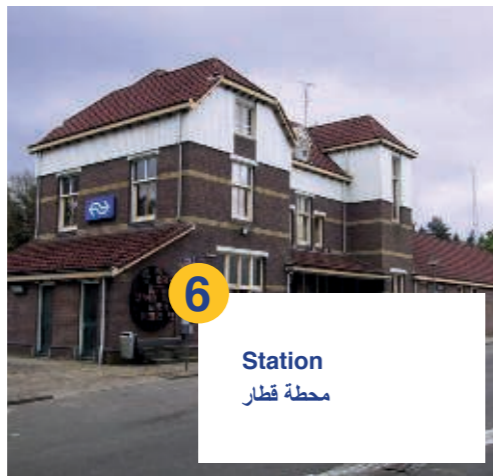
6 Station محطة قطار