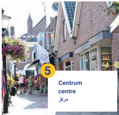
5 Centrum centre مركز