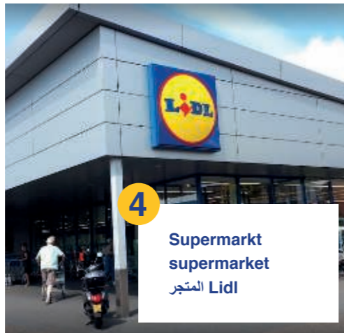
4 Supermarkt supermarket المتجر Lidl