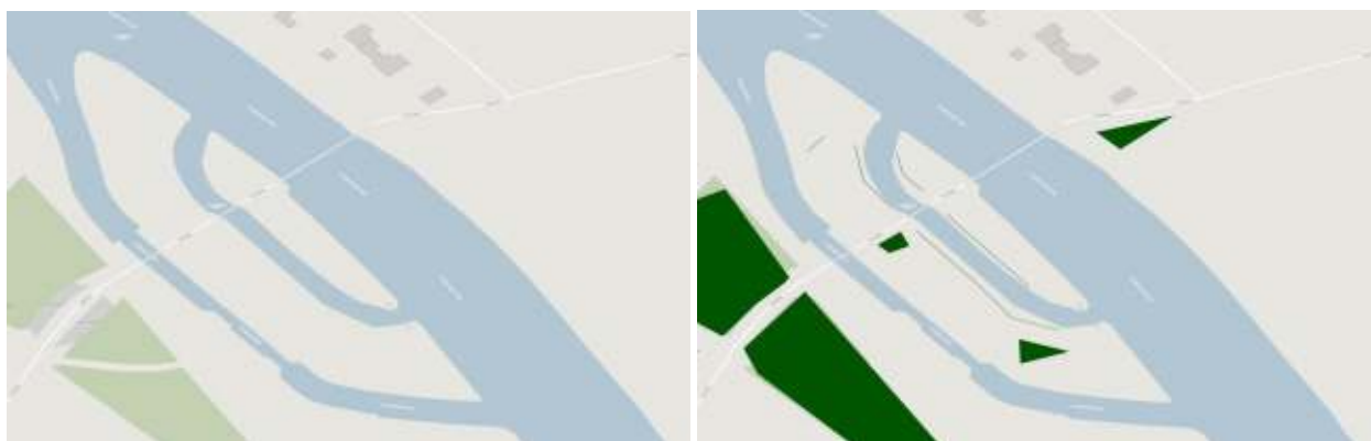
Figuur 2 Links: Uitsnede uit de kaart met beschermwaardige groene elementen. De geïnventariseerde bomen staan niet als beschermingswaardige bomen aangegeven en bevinden zich eveneens niet binnen een beschermingswaardig lijn- of vlakelementen. Rechts: De geïnventariseerde bomen staan als LOP-element als lijn of vlak aangegeven (Ommen 2020).

In het bomenbeleidsplan staat uitgewerkt wat de kenmerken zijn van een beeldbepalende of monumentale boom 1 . Om dit zichtbaar te maken is op de website van de gemeente een digitale kaart beschikbaar waar deze bomen op staan weergegeven. De bomen staan hierop niet als beschermwaardige groene vlakken, lijnen of punten aangemerkt 2 (figuur 2, Ommen 2020).