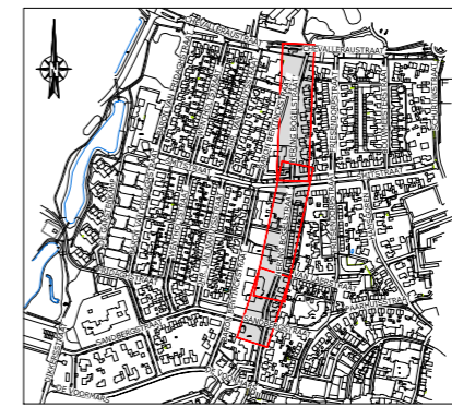
SITUATIE OVERZICHT Schaal 1:500