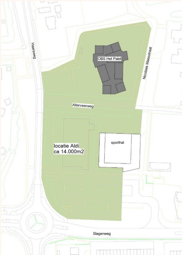
Alternatief A: Locatie Aldi